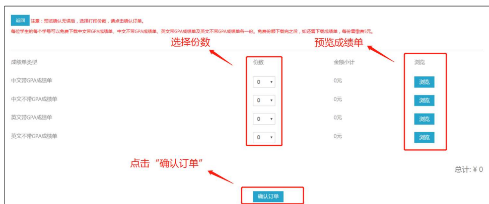
图 6 确认订单界面