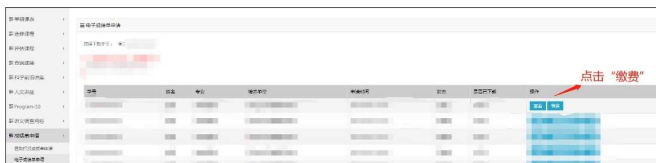
图 5 缴费界面

从“电子成绩单申请”——“缴费”进入订单页面，确认订单之前须先预览成绩单，仔细核对成绩单中姓名、专业、所修课程及成绩等信息是否有误，确认无误后，点击“确认订单”、“保存并返回”或“支付订单”（图 5、6、7）。