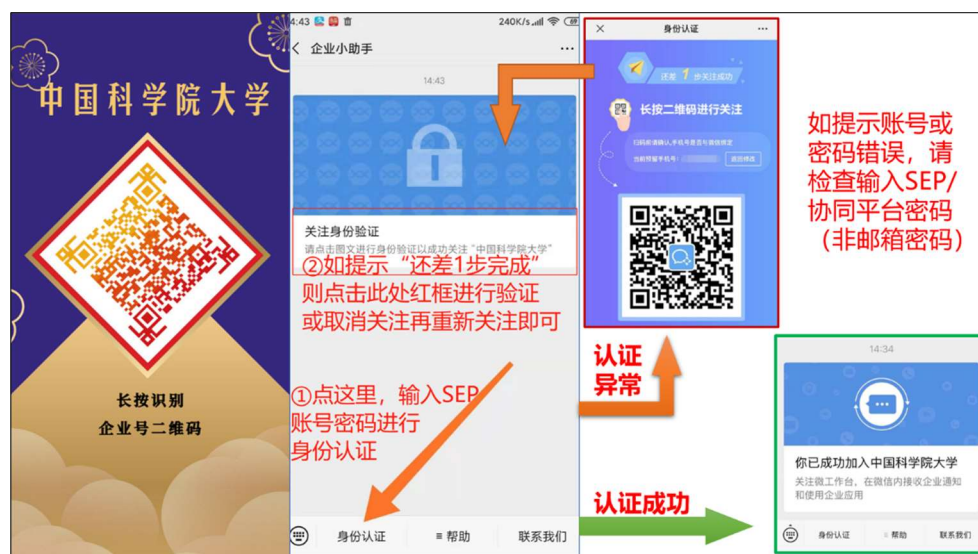
图 2 微信企业号关注流程

2. 关注“中国科学院大学”微信企业号后登陆“选课系统”（微信企业号关注流程见图2）。路径：“中国科学院大学”微信企业号—“网上办事大厅”—“本科部”—“本科生电子成绩单申请”—进入SEP系统—“选课系统”（见图3）。