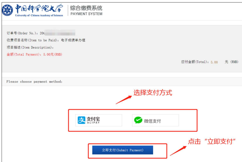
图 7 支付界面