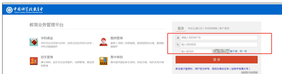
图 1 网页登录 SEP 平台界面

2. 关注“中国科学院大学”微信企业号后登陆“选课系统”（微信企业号关注流程见图2）。路径：“中国科学院大学”微信企业号—“网上办事大厅”—“本科部”—“本科生电子成绩单申请”—进入SEP系统—“选课系统”（见图3）。