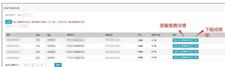
图 8 下载界面

支付成功后，通过“电子成绩单申请”—“下载”界面可下载电子成绩单（见图 8）。自缴费成功之日起，选课系统保存电子成绩单 30 天。超过 30 天，则无法下载，需重新办理。